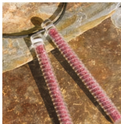
Grösse: 130 x 12 mm

Zu den vielseitigen Anwendungsmöglichkeiten bieten wir Ihnen gerne unsere Beratung an.